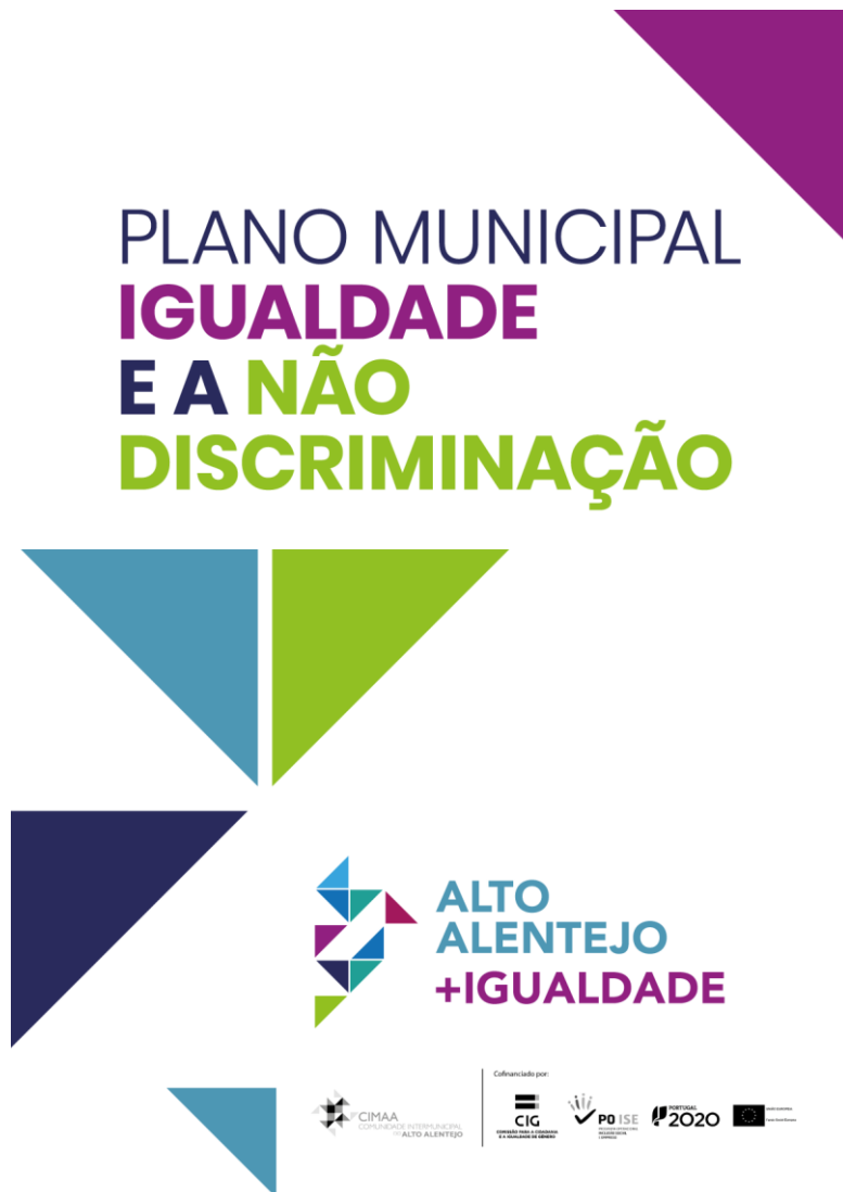
Figura 4 – Poster de divulgação do PMIND