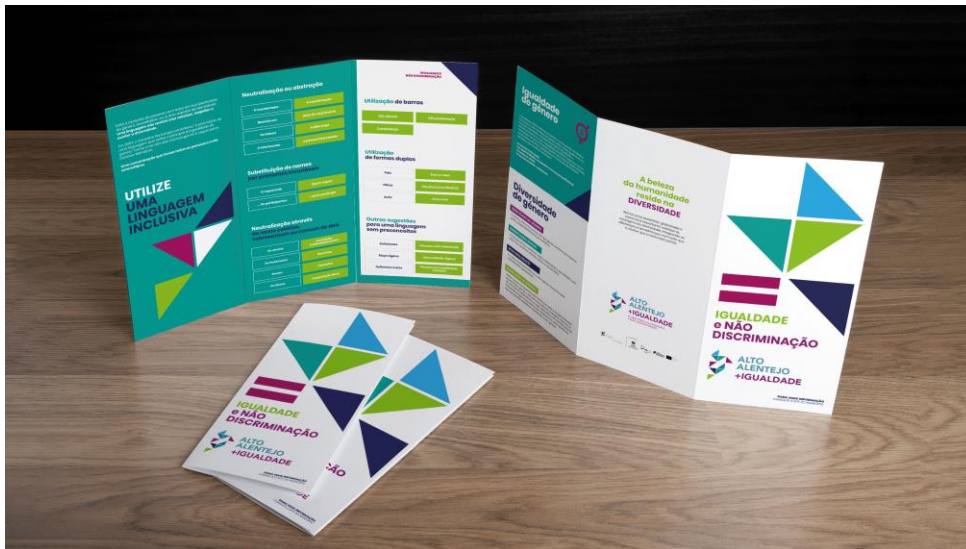
Figura 3 – Flyer sobre a temática da igualdade e da não discriminação